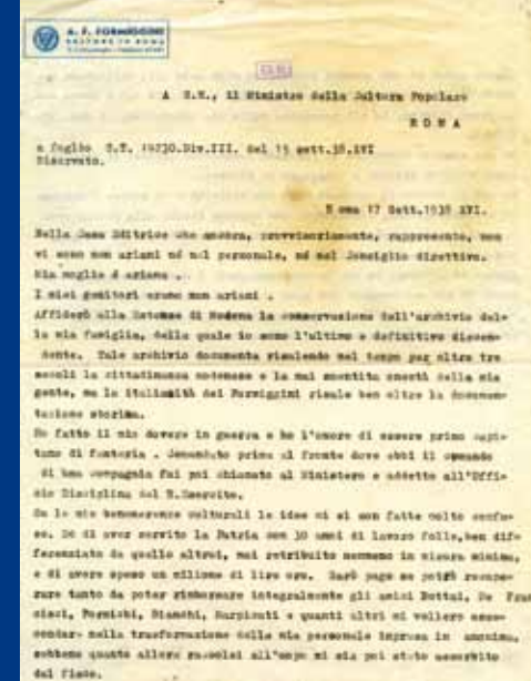
Richiesta di discriminazione dai provvedimenti antisemiti per meriti culturali, indirizzata al Ministero della Cultura Popolare, Roma 17 settembre 1938 (BEUMo, Archivio Familiare Formiggini, cassetta 22, fasc. 251)

centrale. Durante i "quarantacinque giorni" tra il 25 luglio e l'8 settembre 1943, il nuovo governo Badoglio interrompe l'elaborazione di nuovi progetti persecutori, quali la creazione di campi di internamento per tutti gli ebrei assoggettati al lavoro coatto, ma non revoca le leggi emanate dal 1938. Settembre 1943/Aprile 1945 - L'8 settembre viene annunciato l'armistizio tra Regno d'Italia e Alleati. Nelle regioni meridionali la persecuzione cessa. Le regioni centrali e settentrionali sono occupate dal Terzo Reich e assoggettate al nuovo regime fascista della Repubblica Sociale Italiana: gli ebrei vengono ricercati e arrestati dalla polizia tedesca e - dal dicembre 1943 - da quella italiana. Tutti vengono deportati dalle SS, principalmente nel campo di sterminio di Auschwitz-Birkenau. Dal dicembre 1943 all'agosto 1944 il campo nazionale di raccolta per la deportazione è collocato a Fossoli, nel comune di Carpi. Gli ebrei sopravvivono in clandestinità; alcuni (come i ragazzi di Nonantola) fuggono in Svizzera; altri entrano nella Resistenza. Tra gli italiani non ebrei vi sono sia delatori e arrestatori, sia soccorritori. Roma e Firenze sono liberate in giugno e agosto 1944, Modena e le altre città del settentrione a fine aprile 1945