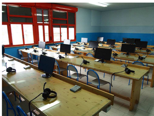
Il laboratorio linguistico